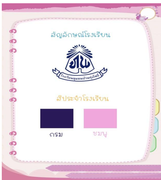
รูปภาพที่ 2.2 สัญลักษณ์โรงเรียน