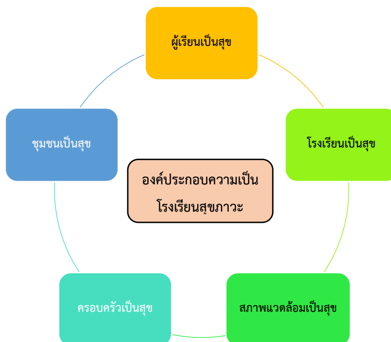
ภาพที่ 2.2 องค์ประกอบความเป็นโรงเรียนเป็นสุข

โรงเรียนสุขภาวะจึงเป็นนวัตกรรมทางการศึกษาที่เป็นทางออกสำคัญยิ่งของการพัฒนาคุณภาพโรงเรียนสู่สุขภาวะ เนื่องจากทิศทางที่ผ่านมาเรามุ่งพัฒนาโรงเรียนให้มีความเป็นเลิศทางวิชาการ มุ่งสร้างเด็กเก่งที่มีความสามารถในการแข่งขันและมุ่งสู่ระบบการศึกษาที่เอาผลสัมฤทธิ์ทางการเรียนเป็นตัววัดคุณภาพโรงเรียนและคุณภาพครูจนมองข้ามเจตจำนงทางการศึกษาที่เราต้องการ “พลเมืองที่มีความสุขทั้งมิติของกายใจ สังคม และจิตวิญญาณ มีวิถีชีวิตที่เชื่อมโยงและสัมพันธ์กันในตัวมนุษย์และสัมพันธ์กับสิ่งแวดล้อมทั้งกายภาพและสังคม และมีความสามารถเชิงการแข่งขันในเวทีโลกได้อย่างมีศักดิ์ศรี” ซึ่งจะเป็นการศึกษาที่สามารถรับมือความท้าทายและการเปลี่ยนแปลงในศตวรรษที่ 21 ได้ การพัฒนาการจัดการศึกษาเพื่อพัฒนาให้เด็กและเยาวชนให้เป็นคนที่สมบูรณ์พัฒนาไปได้อย่างรอบด้าน ในโรงเรียนขนาดเล็กที่มีบริบท ความขาดแคลนใกล้เคียงกัน โรงเรียนขนาดใหญ่มุ่งสู่ความเป็นเลิศตามมาตรฐานสากล หรือโรงเรียนทุกขนาด ทุกระดับต้องหันมามองรอบด้านในการพัฒนาผู้เรียนให้เป็นมนุษย์ที่สมบูรณ์เสริมสร้างศักยภาพได้อย่างสูงสุด เหตุนี้การจัดการศึกษาที่สร้างสุขภาวะในโรงเรียนมีจุดเด่นตรงที่การสร้างประชาคมการเรียนรู้ ทั้งโรงเรียนและระหว่างโรงเรียนหรือภายนอกโรงเรียน เพราะที่ผ่านมาแม้องค์กร หน่วยงาน ผู้เกี่ยวข้องทางการศึกษาต่างพยายามบอกว่า ได้จัดการศึกษาโดยเน้นผู้เรียนเป็นศูนย์กลาง แต่ลืมไปว่าในการจัดการศึกษาอย่างไรก็ตามผู้ที่มีบทบาทสำคัญควบคู่ไปด้วยก็คือครู ดังนั้นความแตกต่างของโครงการนี้กับการจัดการศึกษาของโรงเรียน อื่น ๆ คือ การเน้นให้ครูเรียนรู้ร่วมกันไป