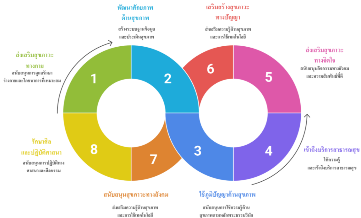
ภาพที่ 4.1 รูปแบบการเสริมสร้างสุขภาวะในโรงเรียนพระปริยัติธรรม แผนกสามัญศึกษา: กรณีศึกษาพื้นที่กรุงเทพมหานคร