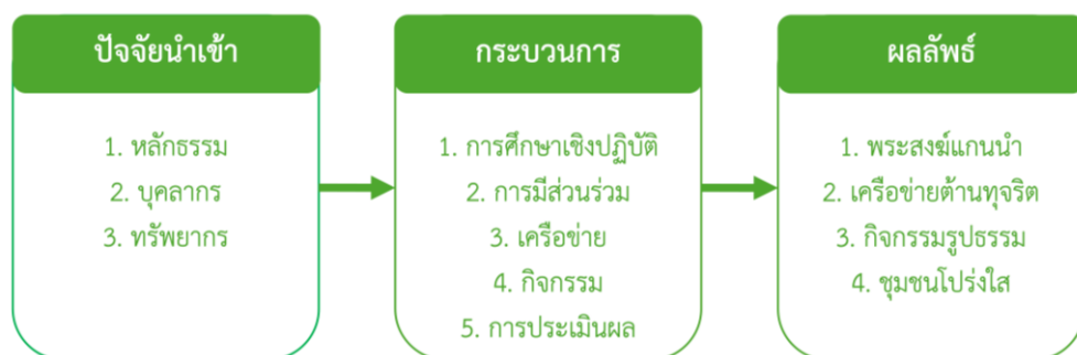
ภาพที่ 4.1 (ร่าง) รูปแบบการขับเคลื่อนการป้องกันการทุจริตตามแนวพระพุทธศาสนาแบบมีส่วนร่วมของพระสงฆ์ในเขตปกครองคณะสงฆ์ ภาค 8

จากองค์ประกอบของรูปแบบ สามารถนำเสนอรูปแบบได้ดังภาพที่ 4.1