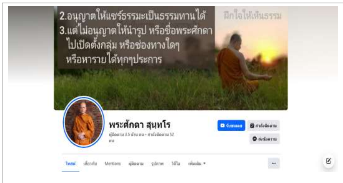
ภาพ 1 เพจพระศกดา สุนทรโร

ประชากรและกลุ่มตัวอย่าง คือ ข้อมูลจากปริจเฉทธรรมะที่ถอดความเป็นตัวหนังสือจากคลิปของพระครูสังฆรักษ์ศกดา สุนทรโรใช้เผยแพร່ผ่านเฟซบุ๊กเพจ “พระศกดา สุนทรโร” ในช่วงวันที่ 1 มกราคม พ.ศ. 2563 - วันที่ 31 ธันวาคม พ.ศ. 2565 รวมเป็นระยะเวลา 3 ปี มีจำนวนปริจเฉททั้งหมด 723 ปริจเฉท