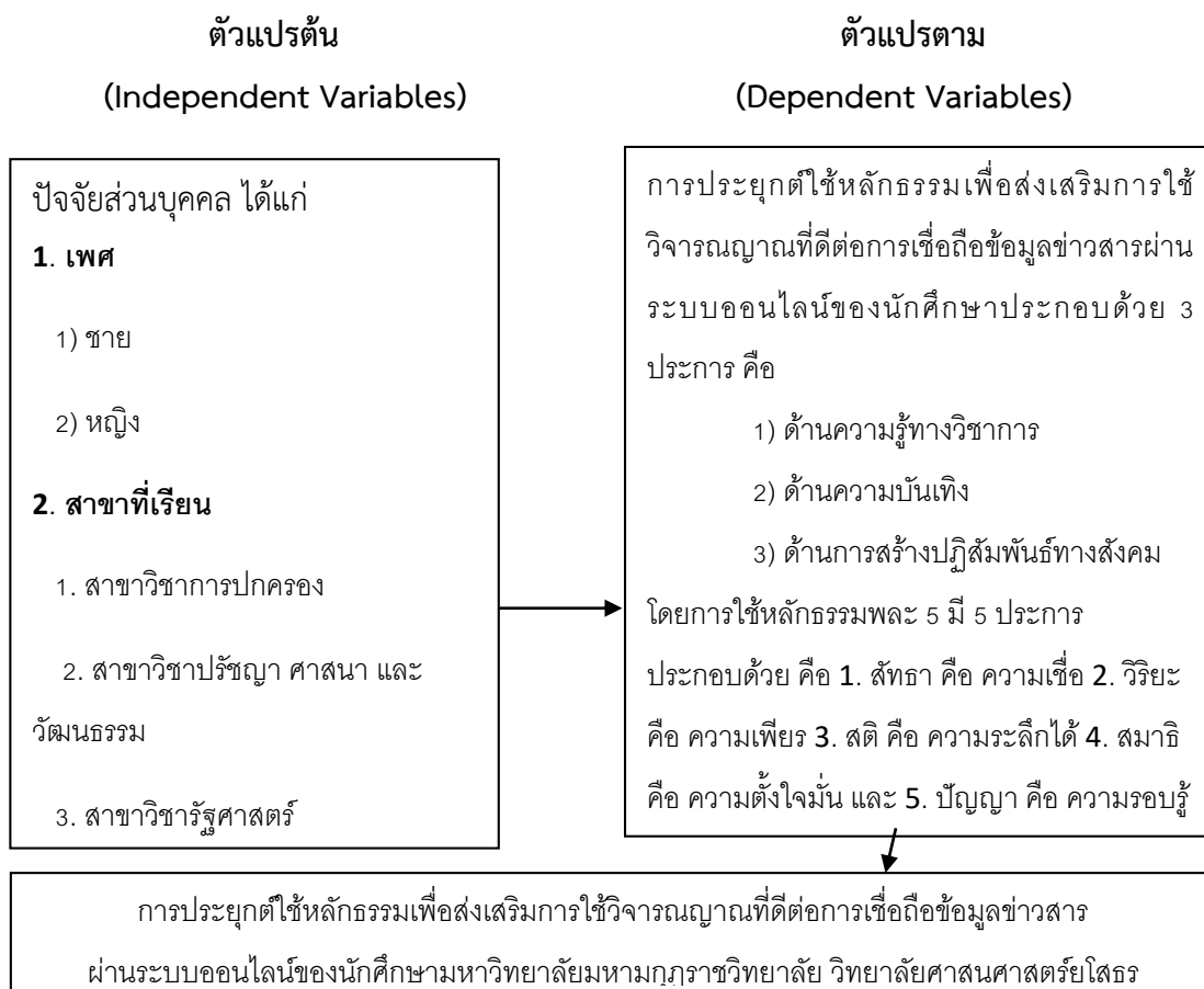
ภาพที่ 2.1 กรอบแนวคิดในการวิจัย