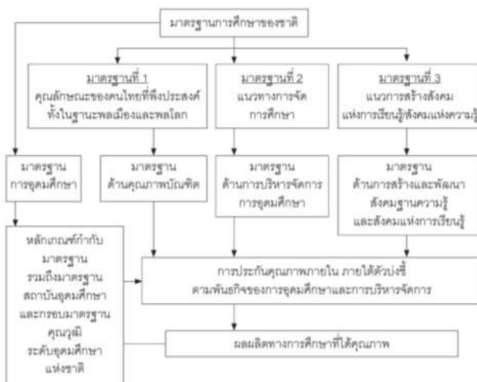
ภาพที่ 2.1 ความเชื่อมโยงระหว่างมาตรฐานการศึกษาและการประกันคุณภาพ (สำนักงาน คณะกรรมการการอุดมศึกษา, 2558)

เพื่อให้การจัดการศึกษาทุกระดับและทุกประเภทมีคุณภาพและได้มาตรฐานตามที่กำหนด ทั้ง มาตรฐาน การศึกษาระดับชาติ มาตรฐานการอุดมศึกษา มาตรฐานสถาบันอุดมศึกษาและสัมพันธ์กับ มาตรฐานและ หลักเกณฑ์ที่เกี่ยวข้องกับการจัดการศึกษาอื่นๆ รวมถึงกรอบมาตรฐานคุณวุฒิ ระดับอุดมศึกษาแห่งชาติ จึงจำเป็นต้องมีระบบประกันคุณภาพที่พัฒนาขึ้นตามที่กำหนดไว้ใน กฎกระทรวงว่าด้วยระบบ หลักเกณฑ์ และวิธีการประกันคุณภาพการศึกษา พ.ศ. 2553 ทั้งนี้ ความ เชื่อมโยงระหว่างมาตรฐานการศึกษา หลักเกณฑ์ ที่เกี่ยวข้อง และการประกันคุณภาพการศึกษาสามารถ แสดงในแผนภาพที่ 2.1 (สำนักงานคณะกรรมการการอุดมศึกษา, 2558)