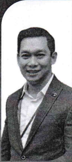
ศ.ดร.อรรถพล กวรเลี้ยง