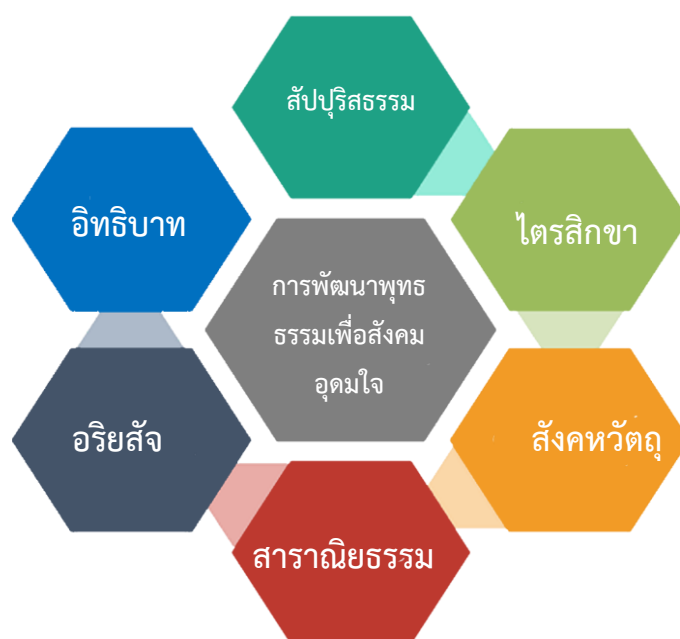
ภาพประกอบที่ 2.1 การพัฒนาหลักพุทธธรรมเพื่อสังคมอุดมใจ

หลักธรรมเพื่อพัฒนาพุทธวิถีชีวิตสังคมอุดมใจ และเพื่อให้การวิจัยเป็นไปตามวัตถุประสงค์ บรรลุเป้าหมายที่วางเอาไว้ และเกิดประสิทธิภาพประสิทธิภาพของงานที่มีคุณภาพและความสำเร็จ มีทั้งหมด 6 หลักธรรมข้างต้น ดังแสดงภาพประกอบ 2.1