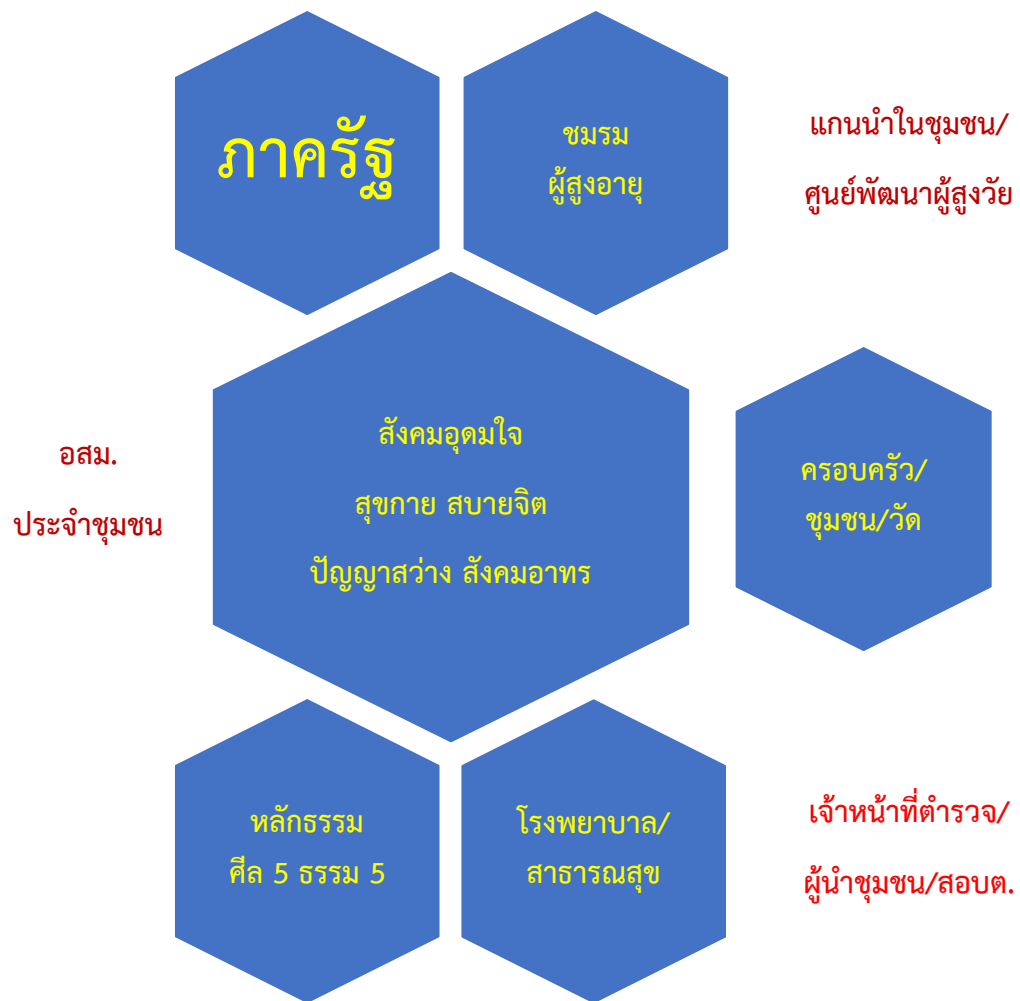
ภาพประกอบที่ 2.3 : นวัตกรรมการพัฒนาพุทธธรรมเพื่อสังคมอุดมใจสำหรับผู้สูงอายุ

เพื่อให้สอดคล้องกับกรอบแนวคิดการวิจัยจึงกำหนดรูปแบบกลไกที่เกี่ยวข้อง ดังนี้