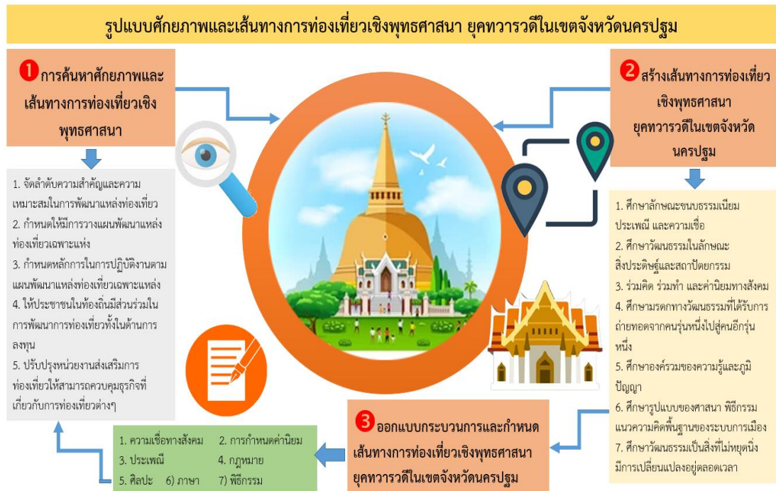
แผนภาพที่ 4.6 รูปแบบศักยภาพและเส้นทางการท่องเที่ยวเชิงพุทธศาสนา ยุคทวารวดี ในเขตจังหวัดนครปฐม

รูปแบบศักยภาพและเส้นทางการท่องเที่ยวเชิงพุทธศาสนา ยุคทวารวดี ในเขตจังหวัดนครปฐม สามารถสรุปเป็นแผนภาพได้ดังนี้