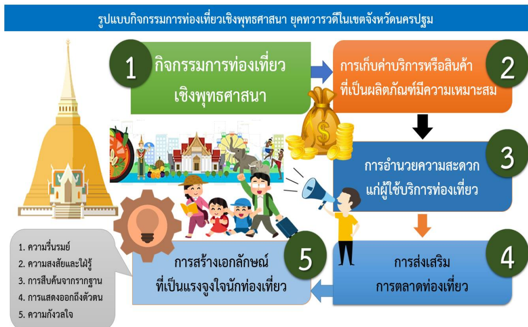
แผนภาพที่ 4.7 รูปแบบกิจกรรมการท่องเที่ยวเชิงพุทธศาสนา ยุคทวารวดี ในเขตจังหวัดนครปฐม