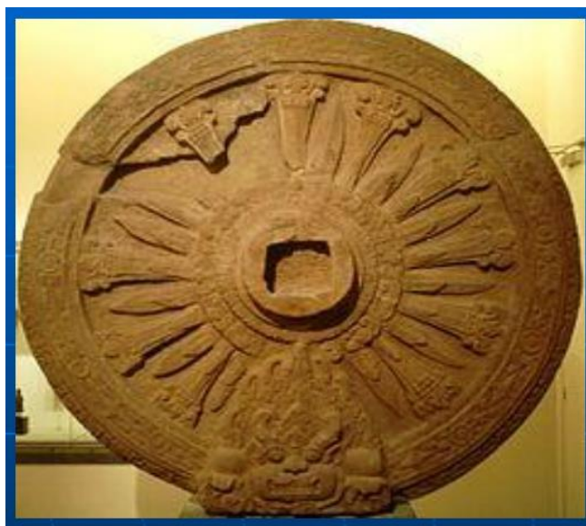
ภาพที่ 4.2 ธรรมจักรในสมัยทวาราวดีพบที่นครปฐม

มีการขุดคุ้ยน้ำคันดิน มีการจัดระเบียบการปกครอง ผลักดันให้ชุมชนในพื้นที่ลุ่มแม่น้ำเจ้าพระยาที่อยู่บริเวณใกล้เคียงอย่าง ราชบุรี นครปฐม และกาญจนบุรี เริ่มพัฒนาขึ้นเป็นเมืองเช่นกัน ก่อเป็นกลุ่มอารยธรรมยุค “ทวาราวดี”