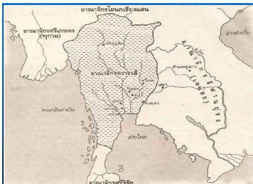
ภาพที่ 4.1 อิทธิพลของทวารวดี

กล่าวโดยสรุป ประวัติประวัติพระพุทธศาสนาพุทธทวารวดี ทวารวดีเป็นอาณาจักรโบราณในดินแดนประเทศไทยก่อนสมัยสุโขทัย มีความหมายว่า เป็นปากประตู ทางการค้า และเป็นชื่อเมืองของพระกฤษณะในมหากาพย์มหาภารตยุทธ กำหนดอายุอยู่ระหว่างพุทธศตวรรษที่ 12-16 เมืองที่เชื่อว่าเป็นศูนย์กลางมี 3 แห่ง คือ เมืองโบราณนครปฐม เมืองโบราณอู่ทอง และเมืองโบราณศรีเทพ คนในอาณาจักรแห่งนี้ นับถือวิญญานนิยม เหมือนคนทั่วไปในเอเชียตะวันออกเฉียงใต้ ศาสนาพราหมณ์ พระพุทธศาสนาเถรวาท และมหายาน โดยที่ศิลปกรรมในทางพระพุทธศาสนาในระยะแรกเหมือนกับต้นแบบคือ ศิลปะคุปตะของอินเดีย ต่อมาได้พัฒนามาเป็นแบบแผนของทวารวดีเองอย่างแท้จริงในราวพุทธศตวรรษที่ 13-15 ปัจจุบันยังมีร่องรอยเมืองโบราณ รวมทั้งศิลปะโบราณ วัตถุสถานและจารึกต่าง ๆ ในสมัยทวารวดีนี้พบเพิ่มขึ้นอีกมากมาย และที่สำคัญได้พบกระจายอยู่ในทุกภาคของประเทศไทย โดยไม่มีหลักฐานของการแผ่อำนาจทางการเมืองจากจุดศูนย์กลาง ดังเช่นรูปแบบการปกครองแบบอาณาจักรทั่วไป