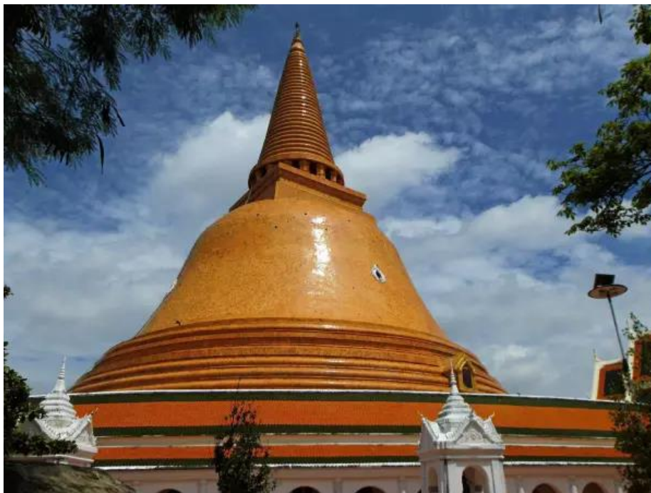
ภาพที่ 4.5 พระปฐมเจดีย์ จังหวัดนครปฐม

อีกทั้งแหล่งท่องเที่ยวสำคัญ คือ วัดพระปฐมเจดีย์ ซึ่งเป็นที่ประดิษฐาน องค์พระปฐมเจดีย์ มหาเจดีย์ที่ใหญ่ที่สุดของประเทศไทย ที่สันนิษฐานว่า น่าจะสร้างในสมัยทวารวดี และเป็นพระเจดีย์เก่ากว่าพระเจดีย์อื่น ๆ ในประเทศสยาม