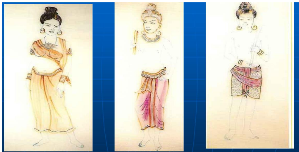
ภาพที่ 4.4 ภาพจำลองการแต่งตัวยุคทราวดี