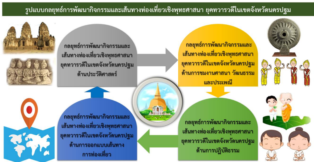
แผนภาพที่ 4.8 รูปแบบกลยุทธ์การพัฒนากิจกรรมและเส้นทางท่องเที่ยวเชิงพุทธศาสนา ยุคทวารวดี ในเขตจังหวัดนครปฐม