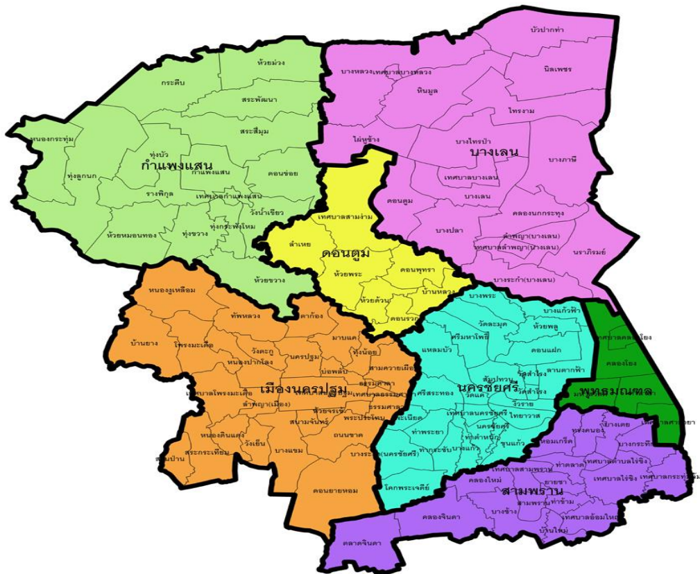
ภาพที่ 2.1 แผนที่จังหวัดฉะเชิงเทรา