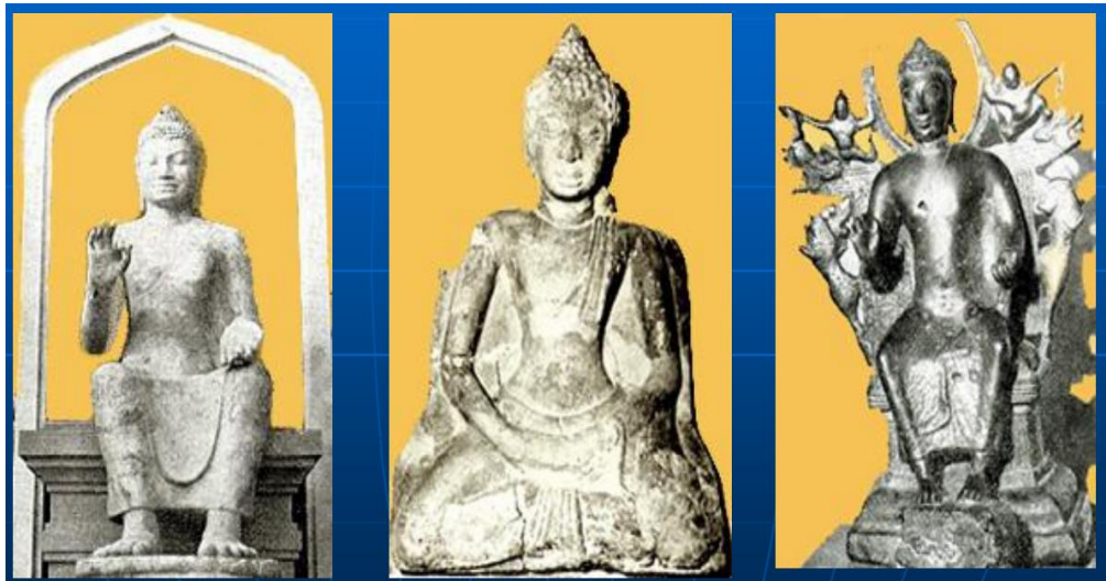
ภาพที่ 4.3 พระพุทธรูปสมัยทราวดี