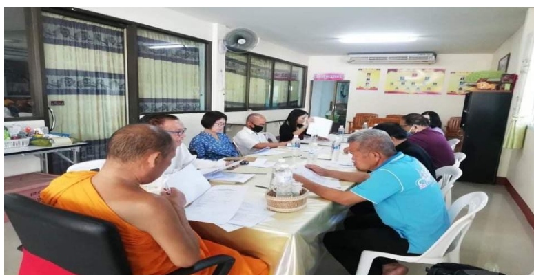
ภาพที่ 5 การสนทนากลุ่มผู้ทรงคุณวุฒิเกี่ยวกับรูปแบบการท่องเที่ยว