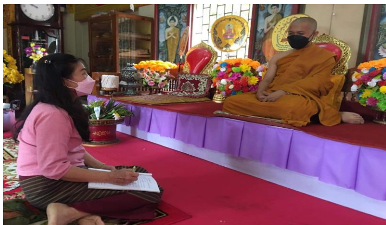
ภาพที่ 1 สัมภาษณ์ผู้ทรงคุณวุฒิทางด้านศาสนา