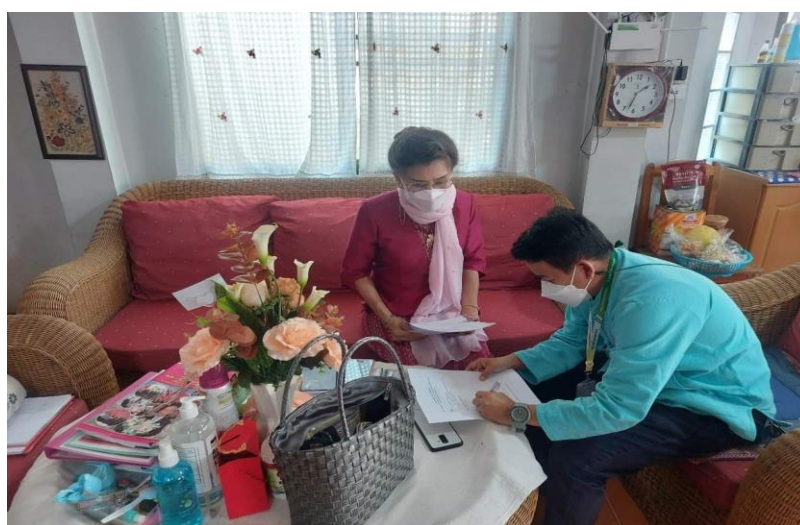
ภาพที่ 3 สัมภาษณ์ผู้ทรงคุณวุฒิที่เป็นผู้นำชุมชนในพื้นที่