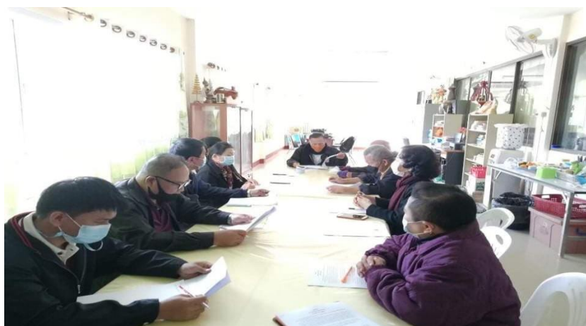
ภาพที่ 6 การสนทนากลุ่มผู้ทรงคุณวุฒิตรวจสอบรูปแบบการท่องเที่ยว