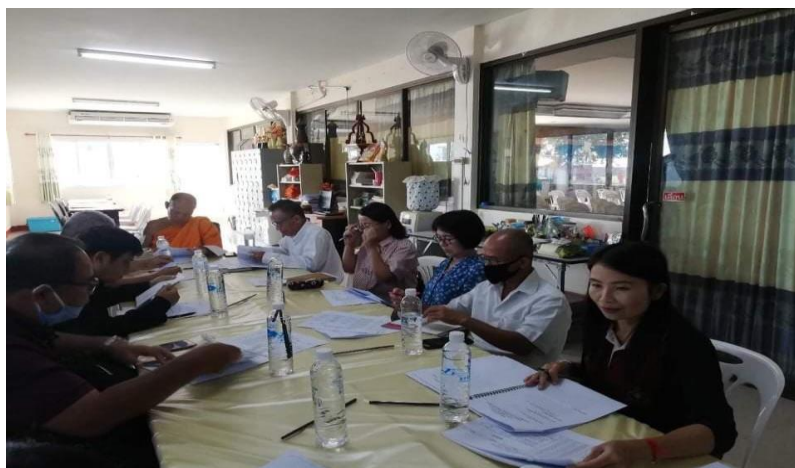
ภาพที่ 4 การสนทนากลุ่มผู้ทรงคุณวุฒิร่างรูปแบบการท่องเที่ยว