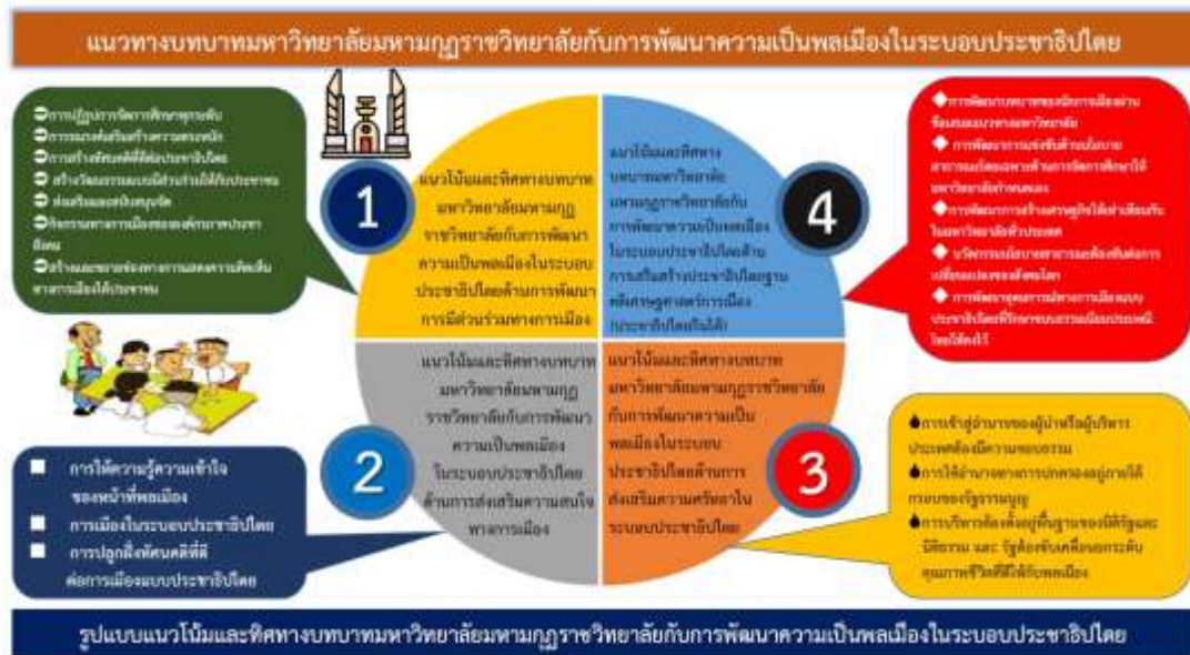
ภาพที่ 4.5 รูปแบบแนวโน้มและทิศทางบทบาทมหาวิทยาลัยมหามกุฏราชวิทยาลัยกับการพัฒนาความเป็นพลเมืองในระบบประชาธิปไตย

รูปแบบแนวโน้มและทิศทางบทบาทมหาวิทยาลัยมหามกุฏราชวิทยาลัยกับการพัฒนาความเป็นพลเมืองในระบบประชาธิปไตย สามารถสรุปเป็นแผนภาพได้ดังนี้