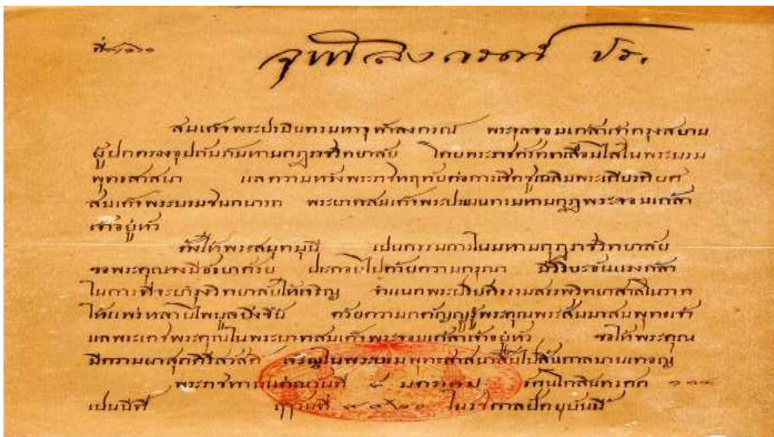
ภาพที่ 4.2 หนังสือลงพระปรมาภิไธ รัชกาลที่ 5 ที่ 8/161 พระ ดร.อนิลมาน ธมฺมสากิโย มอบให้เมื่อ 25 ก.ย. 50