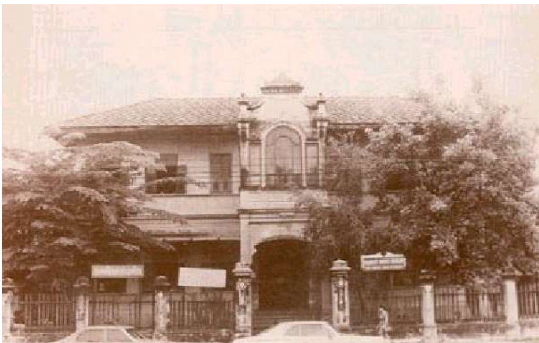
ภาพที่ 4.1 มหาวิทยาลัยมหามกุฏราชวิทยาลัย เมื่อปี พุทธศักราช 2436

เมื่อกิจการของมหามกุฏราชวิทยาลัยได้เปิดดำเนินการแล้ว ปรากฏว่าพระ วัดอุปถัมภ์เหล่านั้นได้รับผลเป็นที่น่าพอใจตลอดมา เพื่อให้พระวัดอุปถัมภ์เหล่านั้นได้ผลดี ยิ่งขึ้น ดังนั้น ในวันที่ 30 ธันวาคม พ.ศ. 2488 สมเด็จพระสังฆราชเจ้า กรมหลวงวชิรญาณวงศ์ ใน ฐานะที่ทรงเป็นนายกรัฐมนตรี มหามกุฏราชวิทยาลัยพร้อมด้วยพระเถระนุเถระ จึงได้ทรงประกาศตั้ง สถาบันการศึกษาชั้นสูงในรูปมหาวิทยาลัยพระพุทธานุศาสน์ขึ้น โดยอาศัยนามว่า สภาการศึกษา มหามกุฏราชวิทยาลัย โดยมีจุดมุ่งหมายดังนี้