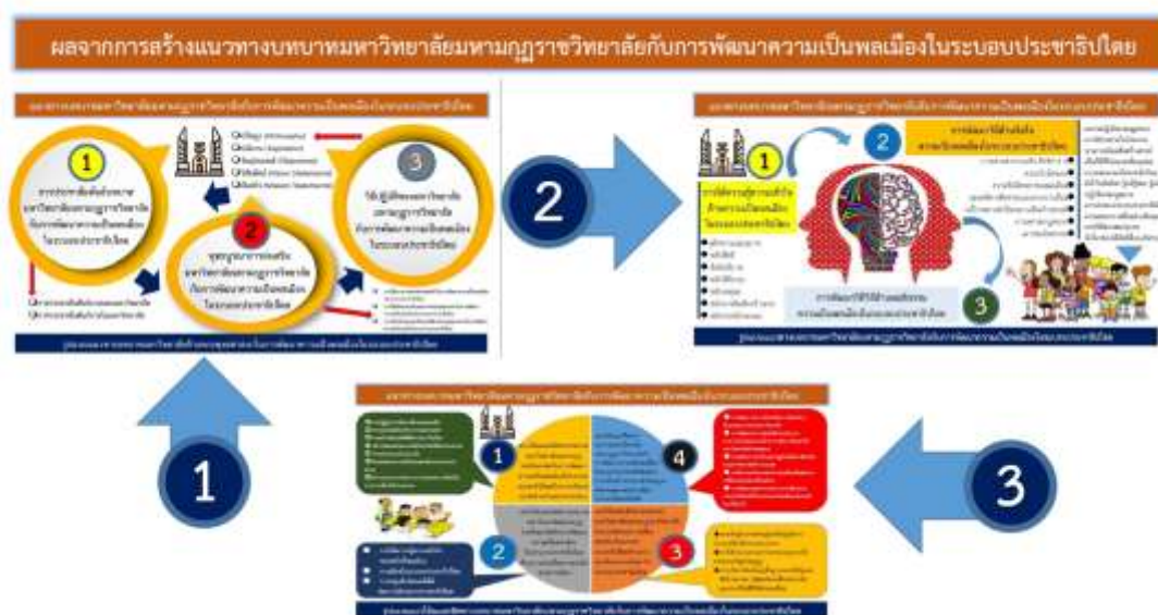
ภาพที่ 5.1 ผังมโนทัศน์ข้อเสนอแนะเชิงวิชาการรูปแบบแนวทางบทบาทมหาวิทยาลัยมหามกุฏราชวิทยาลัยกับการพัฒนาความเป็นพลเมืองในระบอบประชาธิปไตย