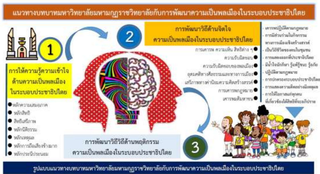
ภาพที่ 4.4 รูปแบบแนวทางบทบาทมหาวิทยาลัยมหามกุฏราชวิทยาลัยกับการพัฒนาความเป็นพลเมืองในระบอบประชาธิปไตย